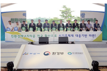
친환경 에너지 타운 아산타운 착공식(7월)