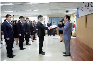
채용형 인턴 임용장 수여 (6월)

여성관리자의 비율을 점진적으로 확대하는 중장기 계획을 수립하였습니다. 직급별 예상 공석의 30~40%를 여성에게 할당하도록 하였고, 우수한 여성인재의 채용 및 육성을 통하여 리더십과 전문성을 갖춘 환경분야 여성전문 인력을 배출하기 위한 노력하고 있습니다.