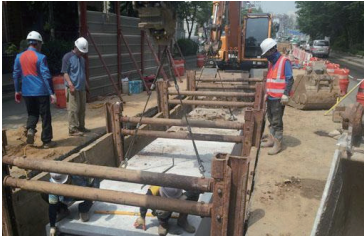
노후 상수도 정비사업