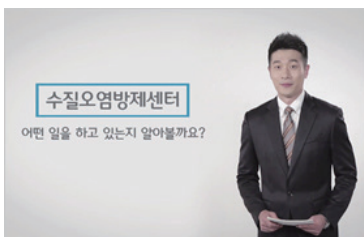
수질오염 방제센터 수질오염사고 교육 콘텐츠

폐기물의 감량 계획으로 폐기물의 원천 감량과 자원순환목표관리 제도화를 추진하고 있습니다. 감량기법과 우수사례의 공유, 시범사업 확대 추진, 기술진단·지도 실효성 제고와 같은 노력으로 시범사업 참여사업자(3개사)가 순환이용률 목표를 달성하였습니다. 자율적인 감량에 의존하던 기존제도를 개선하고자 자원순환 목표관리 시행에 필요한 법적, 제도적 기반을 구축하였으며, 전생애주기 관리체계를 통해 강제성을 부여하여 직·간접적 폐기물 발생 억제효과를 강화하고 있습니다.