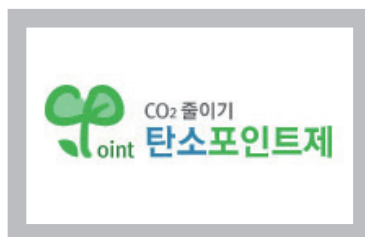
탄소포인트제 전국민 온실가스 감축 실천 프로그램