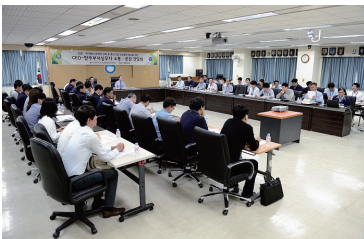
실무자 소통간담회 CEO-발주부서(9월)